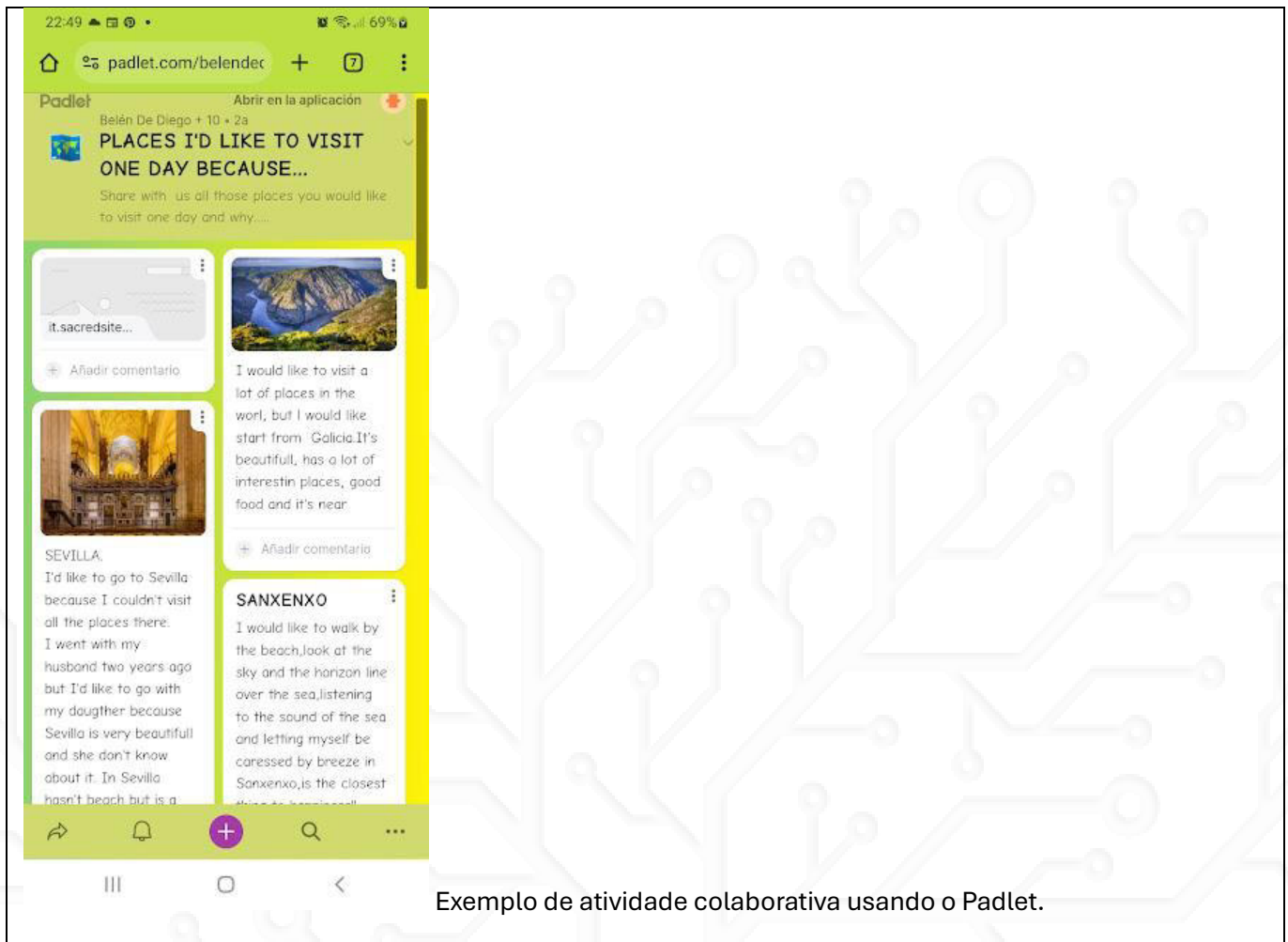
Exemplo de atividade colaborativa usando o Padlet.